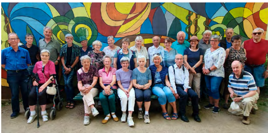
Gruppenfoto der Boule-Spieler