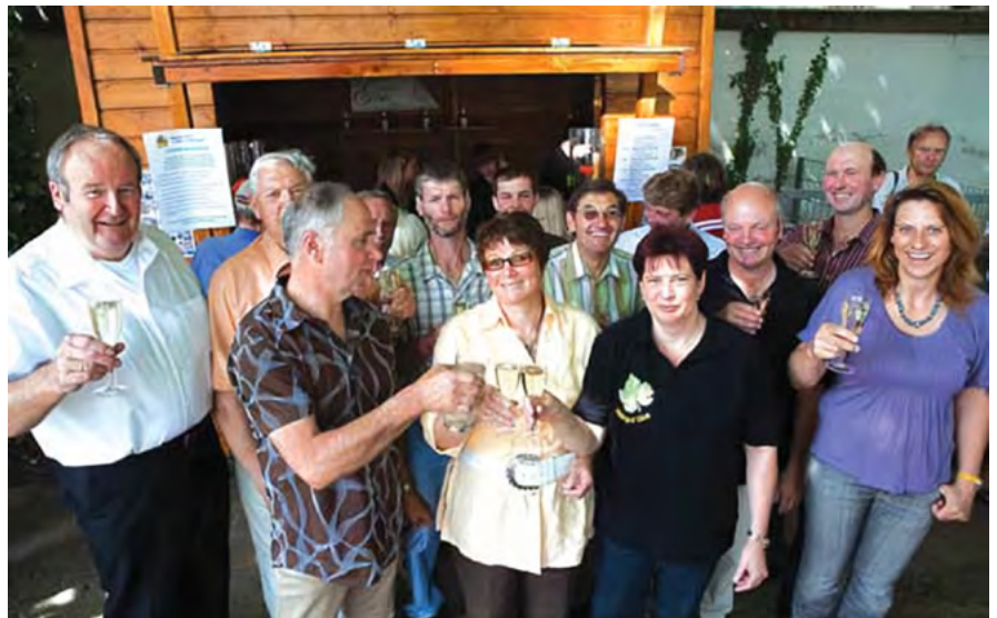
Weinstand-Eröffnung am 6. Juni 2010

Da auf dem Spielplatz Alkoholverbot herrscht, wusste sich die Agenda zu helfen: Dank zahlreicher Spender konnte sie vor dem Spielplatzgelände einen festen Weinstand errichten, der am 06. Juni 2010 feierlich eingeweiht