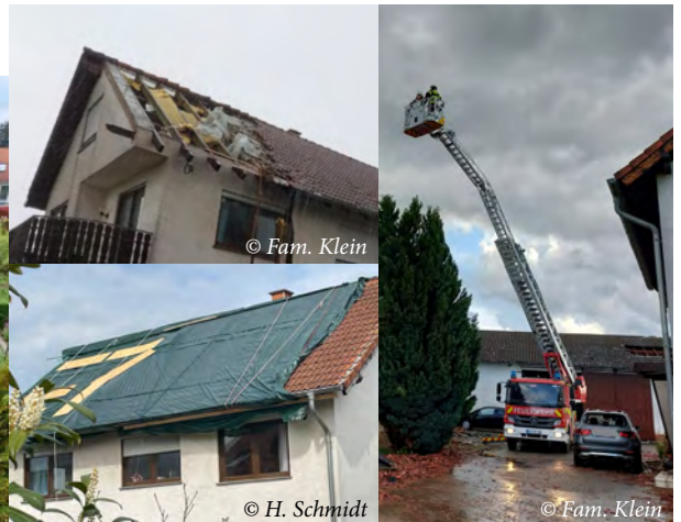
Die Feuerwehr konnte das beschädigte Dach noch in der Nacht abdecken und eine Plane fixieren.

vom 2.5.23). Laut dpa geht der DWD von einem Tornado der Stufe 1 auf der entsprechenden Fujita-Skala aus. Das bedeutet, er war schneller als 120 Stundenkilometer. Am 4. Mai 2023 wurde der Tornado in die Europäische Tornado-Datenbank eingetragen.