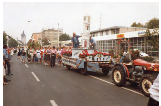
Festumzug zur Weinwerbung in Mainz

1979 fand die Rheinlandpfalz-Rallye mit Genehmigung des Bauern- und Winzervereins (damals Eigentümer der Wege) in Ebersheim statt und Autos brausten durch die Weinberge, einiger Sachschaden wie umgefahrenere Ankersticker waren zu verzeichnen, aber die Schäden wurden wieder behoben. 1981 wurde gemeinschaftlich ein Wegehobel angeschafft, um die Feldwege instand zu halten. Die Vereinsaktivität beinhaltete auch die Teilnahme am Weinwerbeumzug 1983 in Mainz. Aufwendige Wagen wurden hergerichtet und Spenden gesammelt.