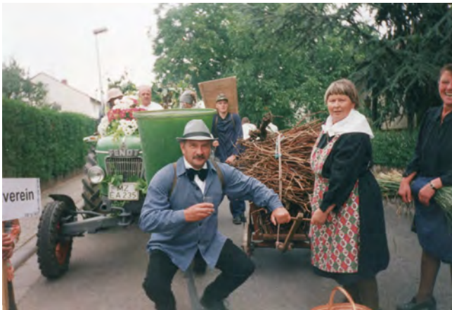
Festumzug 2000 Radsportverein

Das Landschaftsschutzgebiet „Südhang und Südplateau Ebersheim“ wurde 2019 unter Schutz gestellt und umfasst ein ca. 120 ha großes Areal im Süden von Ebersheim.