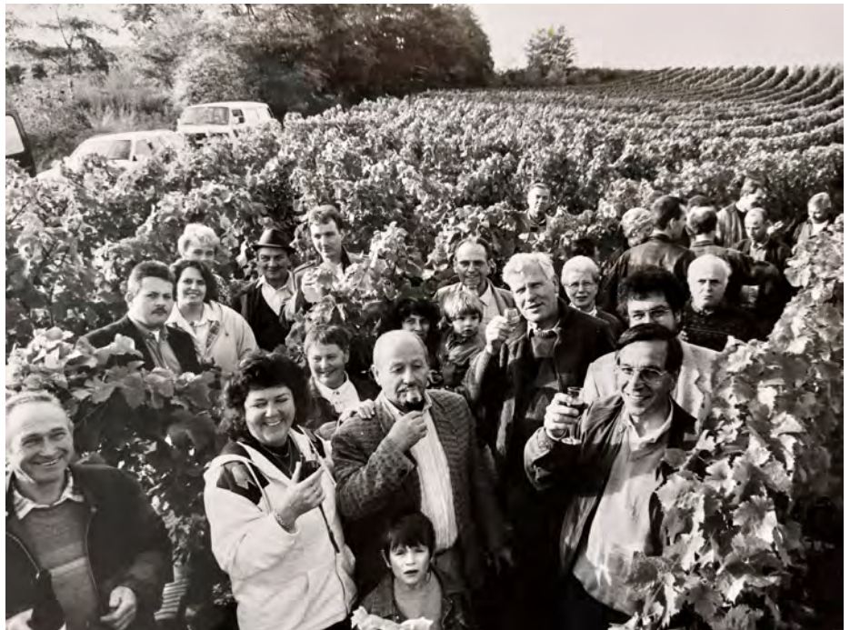
Traditioneller jährlicher Weinbergsrundgang 1993; © Familie Groß

bessere Bezahlungen mit sich brachten. Im Jahre 1976 beschloss der Verein eine weitere Weinbergsumlegung, da aber durch die erst kurz vorher stattgefundene Flurbereinigung viele Neuanlagen noch nicht voll im Ertrag standen und Weinbergsjunganlagen teuer sind, wurde beschlossen die Durchführung in zwei Abschnitten ab 1986 zu beginnen.