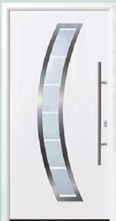
Bestell-Nr.: H11195 - Preis: 2.398,00 € U_d = 1,0 \text{ W/m}^2\text{K}