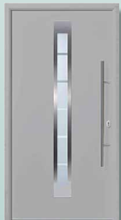
Bestell-Nr.: H11192 - Preis: 2.198,00 € U d = 1,0 W/m 2 K