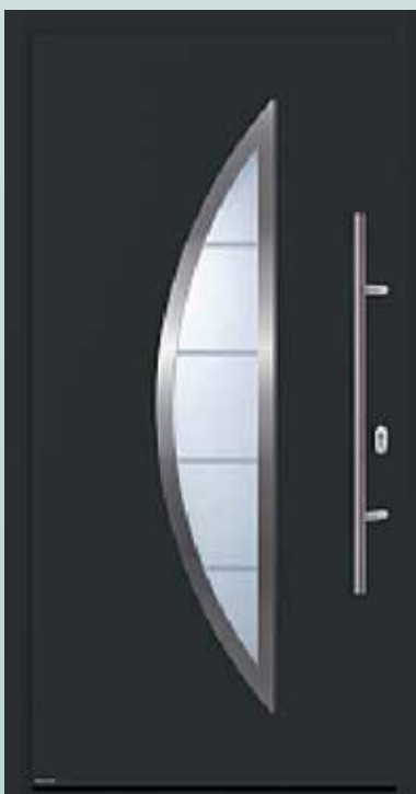
Bestell-Nr.: H11190 - Preis: 1.598,00 € U_d = 1,0 \text{ W/m}^2\text{K}