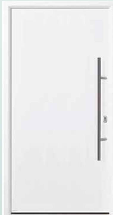
Bestell-Nr.: H10408 - Preis: 1.548,00 € U d = 0,8 W/m 2 K

Alle Preise inkl. 19% MwSt. Der abgebildete Preis bezieht sich auf die Standardausstat- tung der Tür. Abbildungen enthalten mehrpreispflichtige Sonderausstattungen. Drucktechnische Abweichun- gen von den Originalfarben sind möglich.