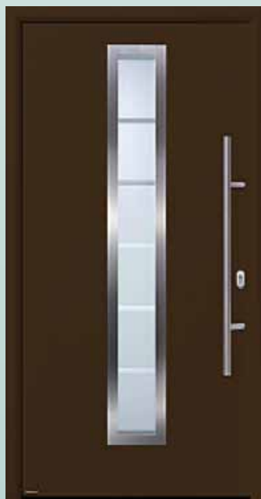
Bestell-Nr.: H11191 - Preis: 2.198,00 € U d = 1,0 W/m 2 K