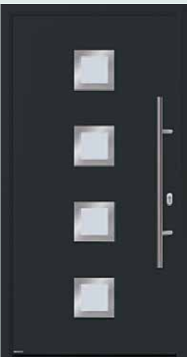
Bestell-Nr.: H11194 - Preis: 2.298,00 € U_d = 1,0 \text{ W/m}^2\text{K}