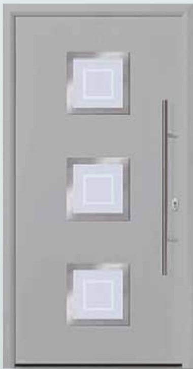
Bestell-Nr.: H11193 - Preis: 2.298,00 € U_d = 1,0 \text{ W/m}^2\text{K}