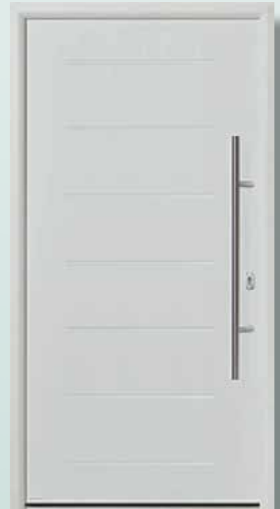
Bestell-Nr.: H11190 - Preis: 1.598,00 € U d = 0,8 W/m 2 K