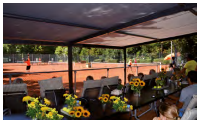
Blick von der Terrasse auf die Tennisplätze des TC Zornheim